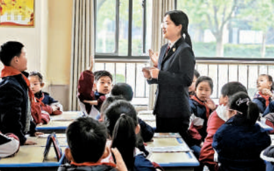
2025年3月，湖北省随州市曾都区检察院“鹿萱和鸣”法治宣讲团开展法治进校园活动。