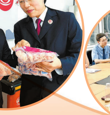
2025年9月，北京市门头沟区检察院办案人员到某出版社开展普法座谈。

会到：检察工作的政绩不在数字、不在报表，而在人民群众的口碑里、在公平正义的实现中。 临沂市是全国著名的商贸名城、物流之都。作为临沂市主城区的基层检察院，该院始终将维护社会安全稳定、护航高质量发展作为首要任务，年均办案量达4000余件。近年来，针对轻罪案件占比日益增长的趋势，该院联合公安、法院、司法等部门成立轻罪办案中心，实行集中办案、集中讯问、集中起诉等“七集中”工作机制，同时优化法律文书，推行要素式审查，大幅提升办案质效。2025年，该院办理的3起案件入选最高人民法院发布的典型案例，轻罪案件办案团队被最高检表彰为全国检察机关优秀办案团队。