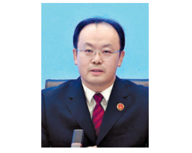
2025年10月，北京市丰台区检察院检察官与河北省检察机关检察官联合走访商标权利公司，详细了解商标使用情况。

“民为邦本”典出《尚书·五子之歌》，原文为“民惟邦本，本固邦宁”，核心是强调民众是国家的根本。《法懂民为本》一书以“民为邦本”为核心，全篇贯通中华优秀传统文化与马克思主义人民立场，系统阐释了民本思想的历史演进、理论内涵与当代实践。 掩卷深思，书中“民为邦本”的深刻启示，与习近平总书记关于树立和践行正确政绩观的重要论述高度契合。这让我更加明晰，为民造福是最大政绩，实干笃行是