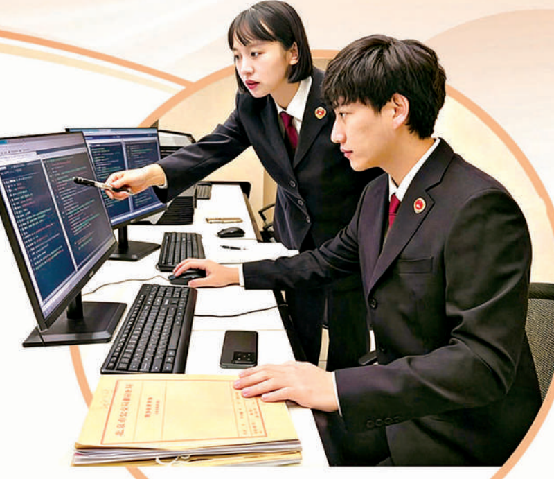
2025年4月，北京市门头沟区检察院办案人员比对涉案代码片段。

会到：检察工作的政绩不在数字、不在报表，而在人民群众的口碑里、在公平正义的实现中。 临沂市是全国著名的商贸名城、物流之都。作为临沂市主城区的基层检察院，该院始终将维护社会安全稳定、护航高质量发展作为首要任务，年均办案量达4000余件。近年来，针对轻罪案件占比日益增长的趋势，该院联合公安、法院、司法等部门成立轻罪办案中心，实行集中办案、集中讯问、集中起诉等“七集中”工作机制，同时优化法律文书，推行要素式审查，大幅提升办案质效。2025年，该院办理的3起案件入选最高人民法院发布的典型案例，轻罪案件办案团队被最高检表彰为全国检察机关优秀办案团队。