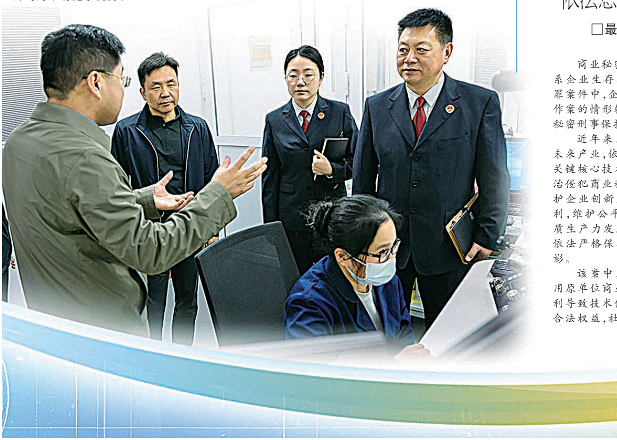
▼办案检察官深入企业实地参观实验室，详细了解企业技术研发与生产经营情况。

主动加强与创新企业的沟通联系，及时了解前沿技术发展状况和高新技术企业知识产权保护需求。发现涉嫌侵犯商业秘密犯罪线索后，建议权利企业向公安机关报案，切实加强企业商业秘密保护。在案件办理过程中，注重发挥侦查监督与协作配合机制作用，就侦查方向和证据要求提出意见建议，完善证据体系。严格围绕侵犯商业秘密罪构成要件强化证据审查，就专业技术问题及时委托鉴定，通过邀请技术调查官辅助审查等方式查明技术事实。加强对涉案商业秘密价值认定依据的审查，准确认定损失数额。针对涉案企业在知识产权管理制度中存在的不足，通过制发检察建议等方式，督促完善风险防控机制，助力提升企业知识产权保护水平。