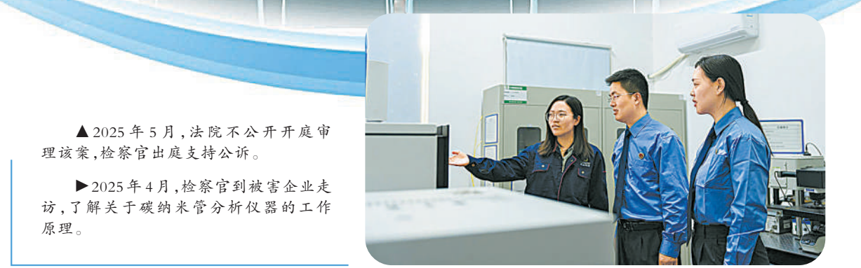
▲2025年5月，法院不公开开庭审理该案，检察官出庭支持公诉。 ▶2025年4月，检察官到被害企业走访，了解关于碳纳米管分析仪器的工作原理。

2023年3月，T公司以民事诉讼开启了维权之路。2023年5月，经开区检察院在一次送法进企业活动中了解到这一情况，发现该线索可能涉嫌刑事犯罪，遂建议T公司向公安机关报案。同年6月，T公司向公安机关报案。