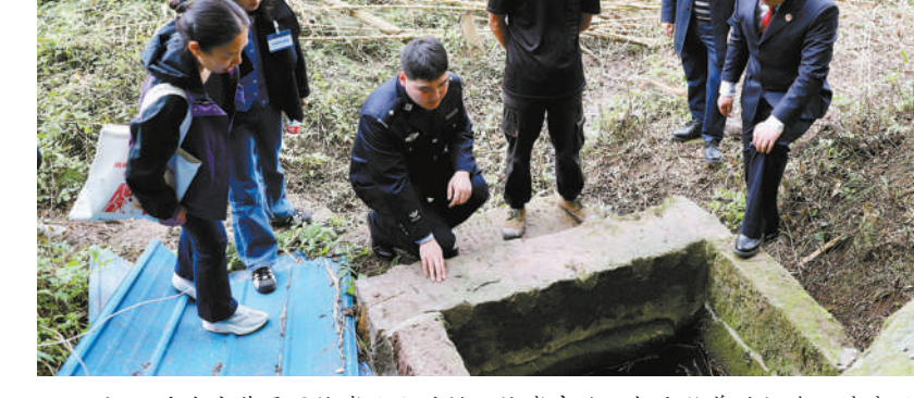
近日，重庆市荣昌区检察院公益诉讼检察官就一起畜牧养殖污染环境案开展调查取证，并邀请人民监督员全程监督。检察官深入养殖污染现场，对污染源及受波及的鱼塘、水井、耕地进行现场勘验，固定证据，同时走访周边群众，全面核实污染损害情况。图为检察官对受污染水井进行现场勘验取证。