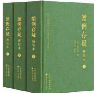
《读例存疑》新校本,孙家红编校,此为薛允升平生律学造诣的集中体现。

薛允升(1820年—1901年),字克猷,号云阶,陕西长安马务村人,陕派律学的核心代表与开创者,既有学者的严谨,又具司法官的刚直。一生著作等身,《服制备考》《汉律辑存》《唐明律合编》《读例存疑》等皆是传统律学经典。其中《读例存疑》对晚清《大清现行刑律》的制定产生了直接且重要的影响,时人评价其“律学之精,殆集古今之大成,秦汉至今,一人而已”。