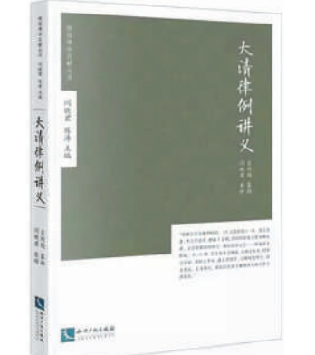
《大清律例讲义》,吉同钧纂辑,闫晓君整理。

吉同钧(1854年—1936年),字石笙,号顽石,陕西韩城人,是陕派律学的最后代表,也是兼具传统律学功底与近代法律视野的学者与司法官。他既继承了薛允升、赵舒翹等人的律学精髓与司法操守,又能顺应时代潮流,主张法律因时因地制宜,为中国法律近代化探索出一条立足本土、兼容中西的务实路径。