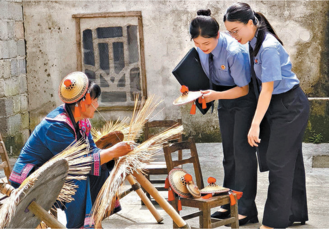
二〇二五年六月,“检三姐”工作团队入户回访被救助的非物质文化遗产传承人,了解其生活情况,提供法律咨询。