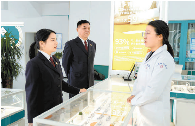
近日,河南省潢川县检察院检察官深入辖区眼科医院进行回访。

与此同时,平凉市检察院在全市部署开展新业态劳动者权益保护专项监督活动,运用大数据模型共筛查出快递从业人员参保异常线索463条,立案3件。截至2025年底,该院推动全市12家快递企业落实418名从业人员工伤、养老“双参保”;督促相关部门办结工伤认定及待遇保障案件13件,支付待遇289.83万元;整改用工问题6项,成功调解快递行业劳动争议7件,为3名从业人员追回工资1.07万元。