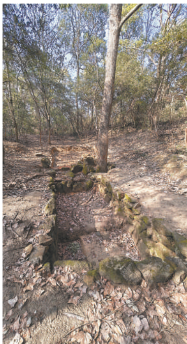
图为2月28日在高岭山上拍摄的古代淘洗池遗址。