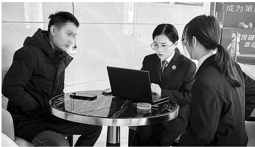
2024年11月，承办检察官到案涉项目房产销售中心调查房产被查封前的销售情况，了解该房产的市场销售价格。

□本报记者 丁艳红 通讯员 殷薇 朱晓敏 因财产保全引发纠纷，几家企业互相起诉，一时陷入困境。经贵州省普定县检察院开展民事检察和解工作，一场经营危机终于迎来转机，涉诉企业走出官司缠身的困境后，轻装上阵、重启经营。 “某房地产开发公司已经出售了部分房屋，向我们支付了部分钱款，一切都在向好的方向发展。”近日，普定县检察院在对案进行回访时，某工程公司负责人告诉检察官。 2019年1月，某建设集团承建了某房地产开发公司位于普定县的商品房建设项目，后又将该项目分包给某工程公司。2023年2月，该项目通过竣工验收，经结算，某房地产开发公司尚欠某建设集团工程款5410余万元。随后，某建设集团与某工程公司签订《债权转让协议》，约定将5410余万元欠款及逾期利息共计7800余万元债权、违约金