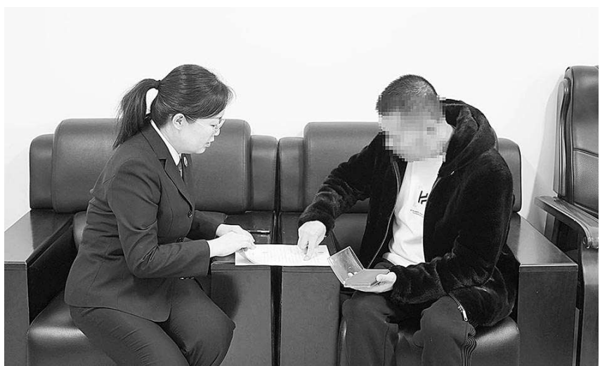
日前，在鄂温克旗检察院检察官的见证下，被申请人在该旗司法局签署和解协议。