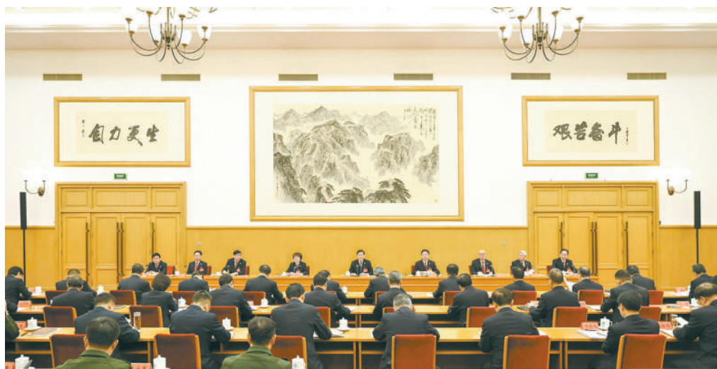
1月13日，全国检察长会议在京召开，最高人民检察院党组书记、检察长应勇出席会议并讲话。

“党的中心工作推动到哪里，检察工作就要跟进到哪里。”应勇强调，要坚持党对检察工作的绝对领导，坚定