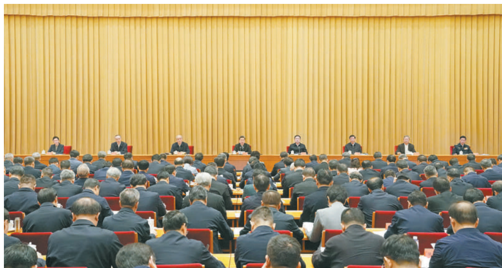
1月12日至13日，中央政法工作会议在京召开。中共中央政治局委员、中央政法委书记陈文清出席会议并讲话。

（记者史兆琨）中央政法工作会议1月12日至13日在京召开。中共中央政治局委员、中央政法委书记陈文清在会上强调，全国政法机关要坚持以习近平新时代中国特色社会主义思想为指导，深刻领悟“两个确立”的决定性意义，坚决做到“两个维护”，全面贯彻党的二十大和二十届二、三中全会精神，坚持党的绝对领导，全面深化改革，落实和完善党管政法工作制度，坚决维护国家