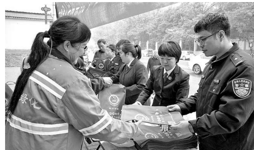
今年11月，陕西省蓝田县检察院组织干警在电力广场开展平安建设集中法治宣传活动。

化解”。该院紧紧围绕“案结事了人和”目标，把释法说理融入办案全过程，调动各方力量积极参与到矛盾纠纷化解中，让矛盾纠纷化解在基层、消弭在萌芽状态。“听证+典型案例”。该院注重总结工作经验，选树典型听证案例，充分运用多种传播载体宣传检察听证工作，以此传递检察好声音、讲述检察好故事、传播法治正能量。 (王腾 王蓉)