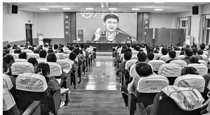
今年3月，陕西省蓝田县检察院在该县城关中学开展以“向校园欺凌勇敢说不”为主题的法治宣讲活动。

罪等重点内容，有针对性地开展法治教育，通过典型案例释法说理，提升未成年人的遵法守法用法意识，学会用法律武器维护自身合法权益。 完善“三个保障”，加大农村地区法治教育力度。强化组织领导，该院党组高度重视农村留守儿童和困境儿童法治宣传教育工作，将农村地区未成年人法治教育列为未成年人检察工作的重点任务。整合人员力量，该院与县安监局、县教育和科学技术局等单位联合会签《蓝田县未成年人违法预防联合保护实施方案》，构建以“检察官+法官+民警+司法行政工作人员”为主体的法治副校长格局，进一步提升农村法治教育能力水平。细化工作方案，该院制定《蓝田县人民检察院农村地区未成年人法治教育工作细则》，突出工作重点，细化工作措施，确保农村留守儿童和困境儿童法治宣传教育工作扎实开展。