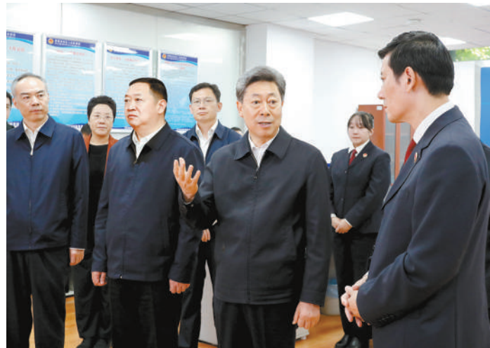
九月十日至十一日，中共中央政治局委员、中央政法委书记陈文清在西藏调研。图为陈文清来到西藏自治区人民检察院调研。