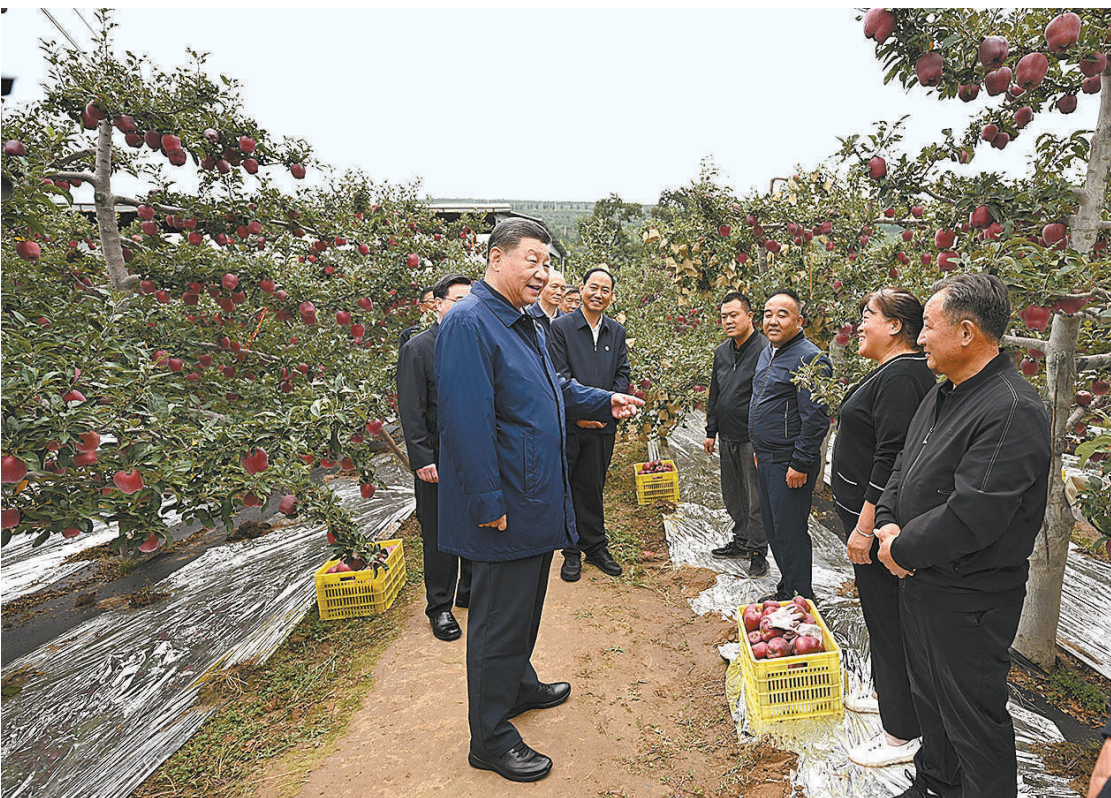
九月十日至十三日，中共中央总书记、国家主席、中央军委主席习近平在甘肃考察。这是十一日上午，习近平在天水市麦积区南山花牛苹果基地考察时，走进果林了解相关种植、技术和管理情况。