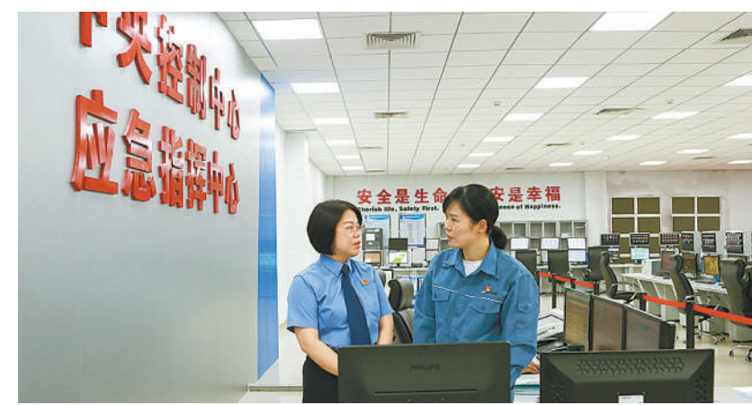
8月28日，福建省漳州市检察院检察长江莉就优化法治营商环境和深化涉台检察工作，听取全国人大代表郭晶晶(右)意见建议。

广“一室多员”涉台检察工作机制和“检察监督+台胞参与+社会共管”涉台文物保护模式，接收台湾地区法科学学生到检察机关实习实训，为深化涉台检察工作积累经验，提供了福建样本，进一步拓宽台胞融入两岸融合发展示范区建设、参与检察工作的途径和渠道。