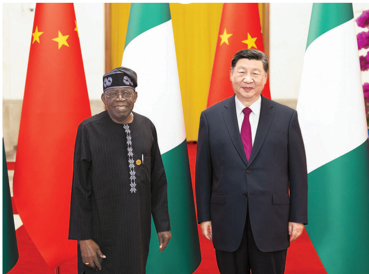
九月三日下午，国家主席习近平在北京人民大会堂同来华出席中非合作论坛北京峰会的尼日利亚总统提努布举行会谈。