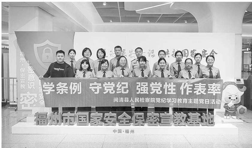
福建省闽清县检察院开展“学条例 守党纪 强党性 作表率”主题党日学习活动。

选好配强领导班子。该院积极配合上级检察院和组织部门对领导班子进行优化调整，2021年以来，从县法