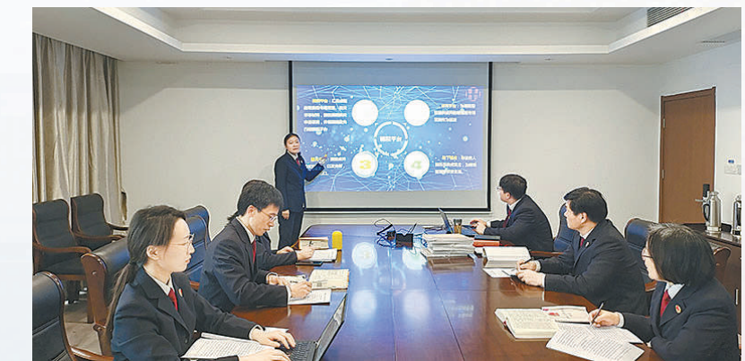
▲办案检察官向检察官联席会议汇报案情。