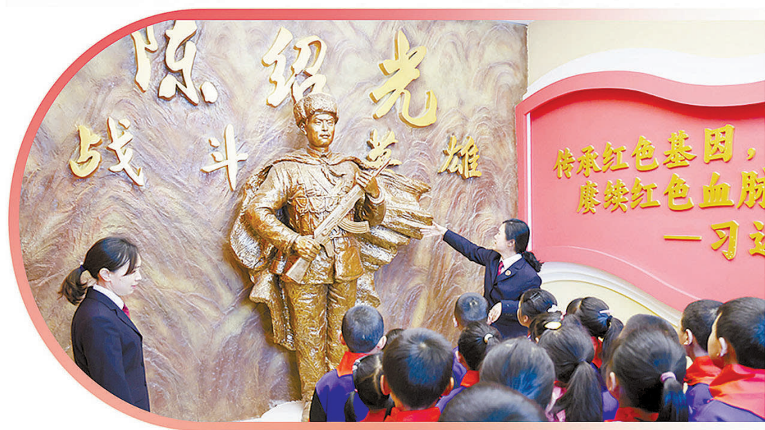
今年3月,四川省宜宾市翠屏区检察院检察官在陈绍光烈士纪念馆向学生介绍陈绍光烈士先进事迹。

强国必须强军,强军才能国安。据了解,近年来四川省检察机关深入贯彻习近平强军思想,立足本地实际,联合军事检察机关在红色资源保护、英烈名誉荣誉保护等领域,持续加强军地检察公益诉讼协作,有力维护国防利益和军人军属、英雄烈士等合法权益。5年来,四川省检察机关与军事检察机关召开联席会议30余次,立案办理涉军类公益诉讼案件31件,其中,机场净空安全领域案件1件、军人权益和地位保障领域案件14件、人民防空领域案件6件、英烈保护领域案件10件。