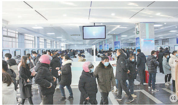
图③:整改后新建成的室内零工市场。