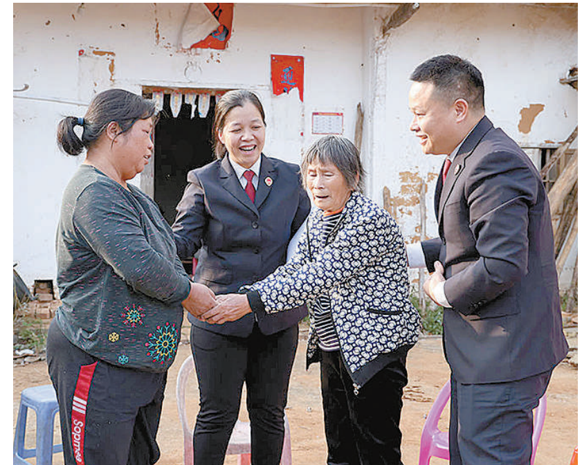
▲双方当事人达成和解,握手言和。 ▼检察官组织双方当事人及其家属进行诉前调解。