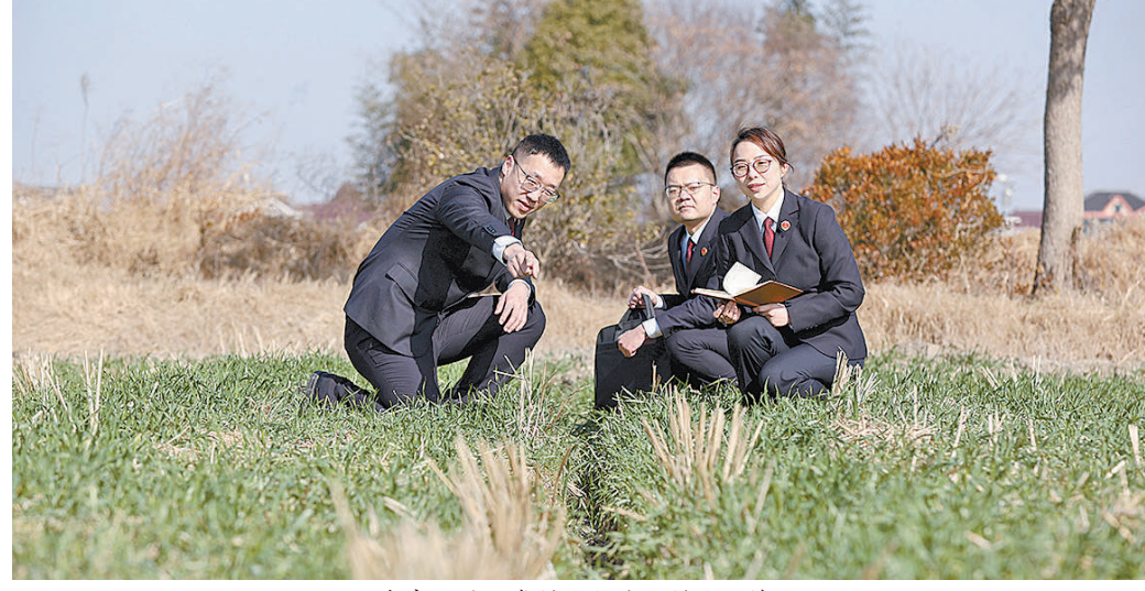
检察官比对正常耕地与受损耕地的情况。

“农田功能一天不修复,检察监督一天不停歇。”近日,浙江省嘉兴市南湖区检察院检察官来到一块被违规占用的农田进行跟进监督。如今,涉案地块部分回填的农田上已覆盖了一层耕层土壤,犁出一道垄沟。