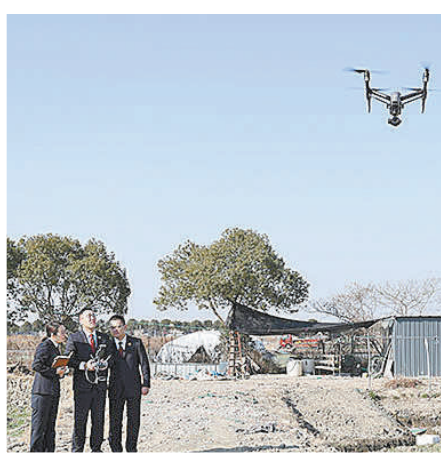
复垦情况进行拍照。