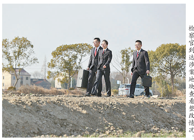
检察官到达涉案地块查看整改情况。