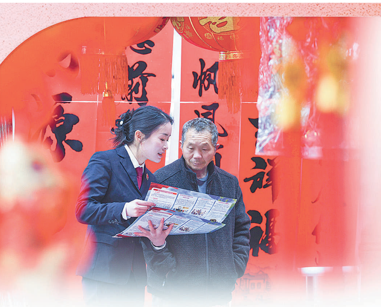
新春临近,各地年货市场热闹非凡。贵州省黄平县检察院组织干警前往旧州镇年货市场,开展防范非法集资和预防电信网络诈骗普法宣传活动,以实际行动切实守护好老百姓的“钱袋子”。