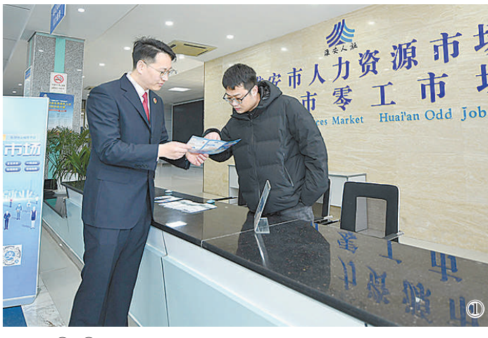
图①、②:检察官向参加招聘的用人单位详细了解企业用工情况,并开展法治宣传服务。

“往年这时我们只能在马路边,举着简陋的招工纸板,大冷天冻得瑟瑟发抖。如今新建成的零工市场,不仅能遮风挡雨,各项设施也一应俱全,快过年了,来应聘的人越来越多。”日前,一位企业主站在自家明亮整洁的招聘摊位前,欣喜地向江苏省淮安经济技术开发区检察院检察官介绍。