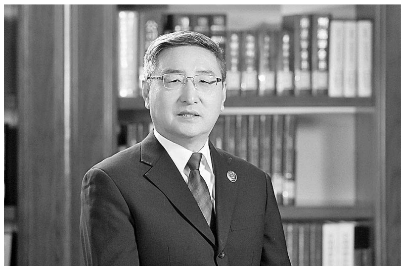
最高人民检察院第六检察厅厅长冯小光接受记者采访。