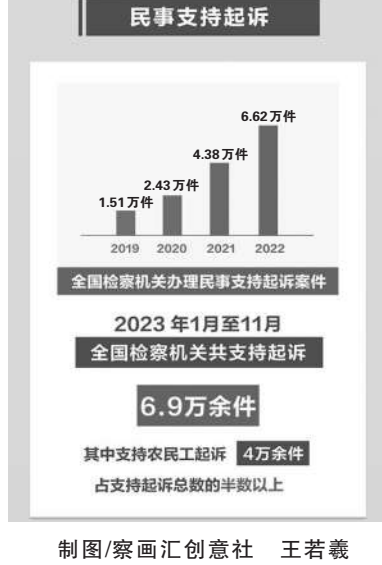
制图/察画汇创意社 王若羲