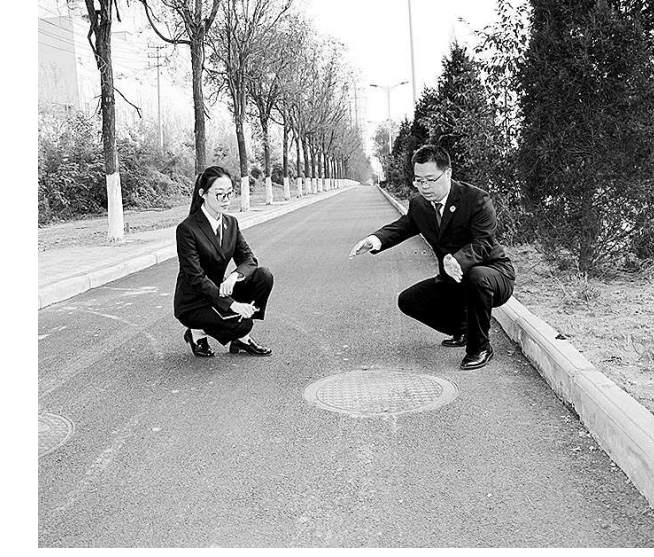
检察官回访查看道路和绿化带整改情况。