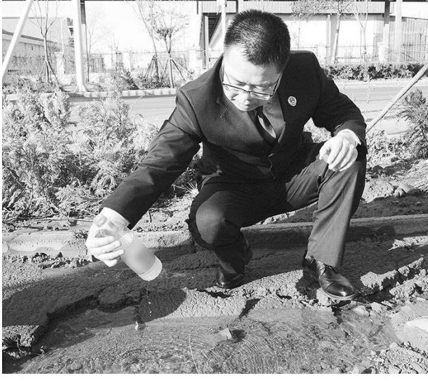
检察官勘查污水横流的道路并现场对污水进行取样。

“现在路面平整宽敞，干净整洁，我们在园区工作更舒心了。” 日前，河南省焦作市卫东区检察院检察官到某园区排污现场回访时，受访企业代表说。 此前，该园区一处公共道路污水横流，水温高水量大，不仅冲毁了路面，烧毁了绿植，流入雨水管网后还造成了管网堵塞，严重污染周边环境。该园区是河南省产业集聚区“智慧园区”建设试点项目，入驻企业130余家，道路污水横流不仅影响出行安全，对园区营商环境也造成不利影响。 该院调查取证后，依法向行政主管部门制发诉前检察建议，督促其全面履职尽责，协调相关单位升级改造污水管网。接到检察建议后，行政主管部门研究制定了整改方案，及时修缮污水管网。检察机关跟进监督，协同相关部门共同推进相适管网升级改造及后期道路硬化、苗木绿化等工作，从根本上提升污水管网排水能力，保障企业和群众通行安全。 本报记者张海燕 通讯员丹晴撰