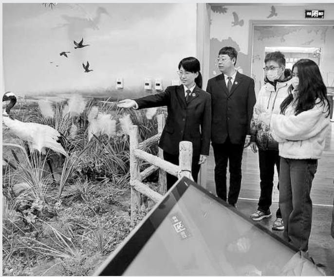
上图:在衡水湖生态环境修复基地,检察官向游客开展爱鸟护鸟宣传。