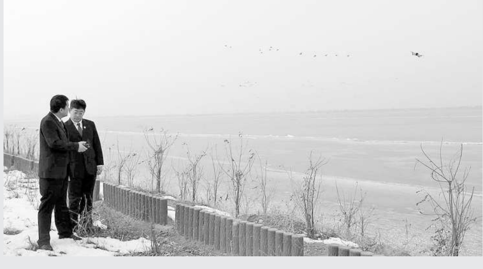
右图:检察官在衡水湖国家级自然保护区利用无人机巡查鸟类食源地和栖息地。