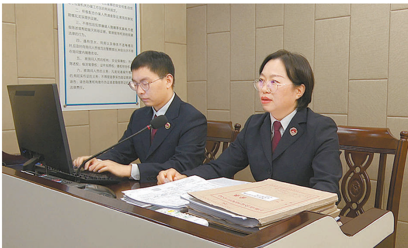
今年9月,检察官及检察官助理提审被告人。

一些“白户”在拿到好处费后,就不会再主动要求查看信用卡的相关信息。且手机卡都是现办的,大部分拿到好处费后就丢掉了,所以银行这边信贷资金发生逾期,也联系不上客户。