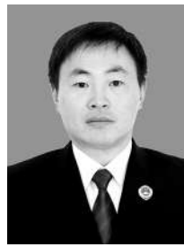
安徽省定远县检 察院党组书记、检察 长 雍自明

近年来,安徽省定远县检察院持续聚焦强化系统化建设,先后探索集成了绩效管理系统、质量管理系统、执行管理系统等可推广、可复制的先进做法,以有力举措奋力推进检察工作现代化。