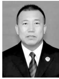
甘肃省白银市白 银区检察院党组书记、 检察长 吴永鹏

近年来,甘肃省白银市白银区检察院紧紧围绕法律监督主责主业,立足检察工作实际,常态化、常态化开展保护企业合法权益专项行动,让该项工作在基层检察院落地、生根、发芽、结果。