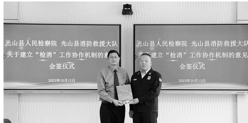
今年10月13日,光山县检察院与县消防救援大队联合召开了消防安全协作配合工作座谈会,共同会签了《关于建立“检消”工作协作机制的意见》。

收到检察建议后,相关职能部门在各自职责范围内迅速开展行动,对存在的消防安全风险隐患进行排查整治。光山县应急管理局会同县消防救援大队对辖区高层小区进行排查,下达责令限期整改通知书16份,制作消防宣传展板30余块,发放宣传手册300余份;光山县住建局成立物管小区消防安全检查小组,对辖区已备案入住的60个物管小区进行交叉检查,责令7家物业公司16个物管小区对占用消防通道、“飞线充电”等问题进行整改,并组织物业公司人员和业主进行消防演练20余次,参加演练人员达500余人次。属地政府成立专项治理领导小