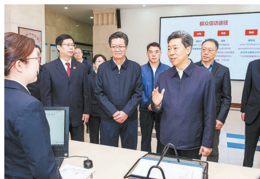
11月13日至15日，中共中央政治局委员、中央政法委书记陈文清在广东调研。图为陈文清来到广州市海珠区人民检察院调研。

陈文清深入广州市黄埔区社会治理综合服务中心，了解信访法治化、新时代“枫桥经验”广东实践等情况。他指出，要处理好“访”和“诉”的辩证关系，二者既相互区别，又相互联系。“访”解决不好就会更多地进入“诉”，“诉”解决不好又会更多地转回到“访”。要推