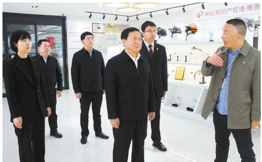
今年10月25日至26日，陕西省检察院党组书记、检察长王旭光(右三)在商洛市检察机关调研，其间前往商洛市检察院知识产权检察保护重点企业了解工作情况。