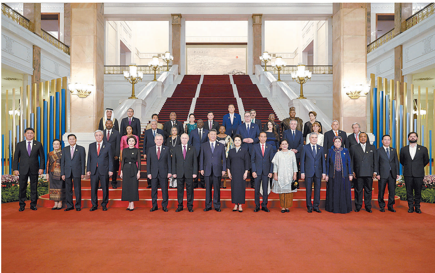
10月17日晚,国家主席习近平和夫人彭丽媛在北京人民大会堂举行宴会,欢迎来华出席第三届“一带一路”国际合作高峰论坛的国际贵宾。这是习近平和彭丽媛同国际贵宾合影留念。

新华社北京10月17日电(记者杨依军 孔祥鑫) 10月17日晚,国家主席习近平和夫人彭丽媛在人民大会堂举行宴会,欢迎来华出席第三届“一带一路”国际合作高峰论坛的国际贵宾。李强、赵乐际、王沪宁、蔡奇、丁薛祥、李希、韩正出席。 秋日北京,夕阳入画,天安门广场华灯绽放,人民大会堂庄严肃穆。出席高峰论坛的外国国家元首、政府