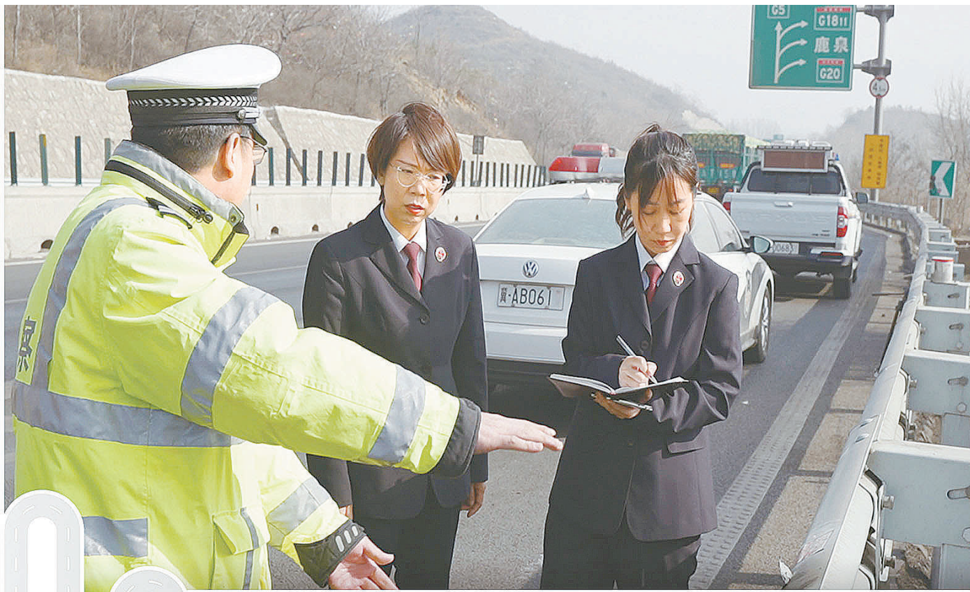
承办检察官去实地调查核实。