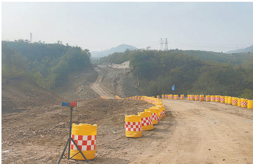
▲目前青银高速石太路段改造提升工程正在施工中，改造后该路段设计时速拟定为80km。

公安交管部门提供的数据显示，截至5月31日，在检察机关的监督下，该部门已撤销同类处罚6200余件。据记者了解，相关部门已启动对青银高速石太段的改造提升工程，改造后，案涉路段的设计时速拟定为80km。目前，该路段正在封闭施工中。