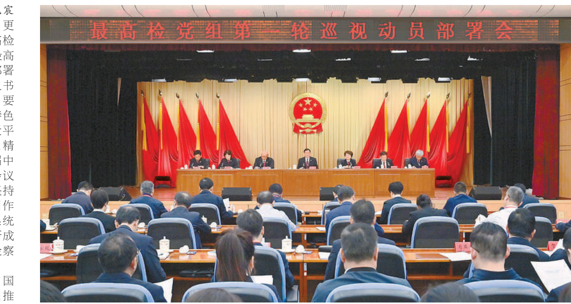
10月9日,最高人民检察院党组第一轮巡视动员部署会在京召开,最高检党组书记、检察长应勇出席会议并讲话。

应勇指出,巡视监督是党和国家监督体系的重要组成部分,是推进党的自我革命、全面从严治党的战略性制度安排。党的十八大以来,以习近平同志为核心的党中央把巡视工作提到前所未有的新高度,巡视制度十年磨一剑,成为党之利器、国之利器。检察系统内巡