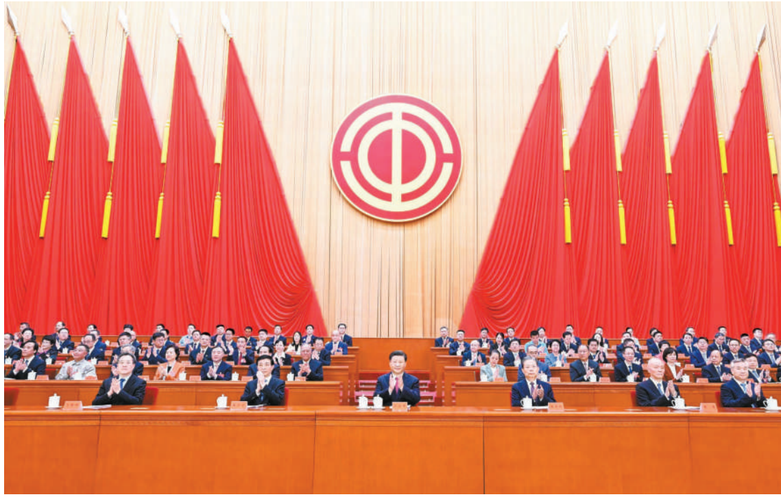
10月9日,中国工会第十八次全国代表大会在北京人民大会堂开幕。习近平、赵乐际、王沪宁、蔡奇、丁薛祥、李希等在主席台就座,祝贺大会召开。

新华社北京10月9日电 中国工会第十八次全国代表大会9日上午在人民大会堂开幕。习近平、赵乐际、王沪宁、丁薛祥、李希等党和国家领导人到会祝贺,蔡奇代表党中央致词。 人民大会堂大礼堂气氛热烈。主席台上悬挂着“中国工会第十八次全国代表大会”的会标,后幕正中象征着中国工会和中国工人阶级团结统一的工会会徽熠熠生辉,10面红旗分列两侧。二楼眺台悬挂着“坚持以习近平新时代中国特色社会主义思想为指导,全面贯彻党的二十大精神,组织动员亿万职工为全面建设社会主义现代化国家、全面推进中华民族伟大复兴团结奋斗!”的巨型横幅。 近2000名来自全国各行各业的中国工会十八大代表和50余名特邀代表,肩负着亿万职工的重托出席大会。 上午10时,中共中央总书记、国家主席、中央军委主席习近平等步入会场,全场响起热烈的掌声。 大会主席团常务主席王东明宣布大会开幕。全体起立,高唱国歌。 蔡奇代表党中央发表了题为《奋力书写我国工人阶级投身强国建设民族复兴的壮丽篇章》的致词,向大会召开表示热烈祝贺,向全国广大职工和工会干部致以诚挚问候。 蔡奇在致词中说,党的十八大以来,在以习近平同志为核心的党中央坚强领导下,我国工人阶级紧紧团结在党的周围,勇担重任、拼搏实干,为推动党和国家事业取得历史性成就、发生历史性变革作出了重要贡献。中国工会十七大以来,各级工会坚持以习近平新时代中国特色社会主义思想为指导,加强党的建设,深化改革创新,强化职工思想政治引领,推进产业工人队伍建设改革,履行维权服务职责,构建和谐劳动关系,动员广大职工积极建功新时代,同全国人民同步迈向全面建设社会主义现代化国家新征程。