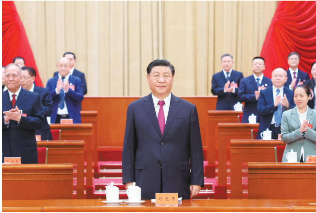
10月9日,中国工会第十八次全国代表大会在北京人民大会堂开幕。这是中共中央总书记、国家主席、中央军委主席习近平在主席台向与会代表致意。