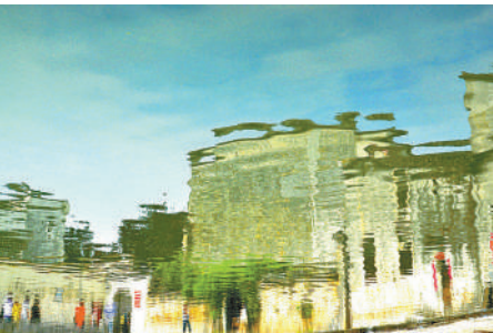
水中江南

我的家乡多宝湾位于美丽的汉江边。汉江是长江最大的一条支流,发源于秦岭南麓的陕西省宁强县,沿途流经陕西汉中、安康,湖北丹江口、襄阳、天门、潜江等地,最后在汉口龙王庙汇入长江,全长1577公里。因流经多宝湾形成一个大大的湾,多宝湾因此而得名。南水北调重要枢纽工程兴隆大坝就横亘在汉江之上,一边是天门市多宝镇,一边是潜江市高石碑镇。