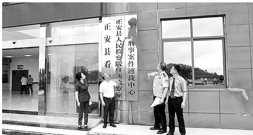
正安县刑事案件速裁中心揭牌仪式。

据了解，今年5月，由正安县检察院、县公安局、县法院等有关部门共同参与的“正安县刑事案件速裁中心”在正安县看守所挂牌成立。该中心集中设置了专门办案办公室、认罪认罚具结室、速裁审判庭等必要办案场所，并联通了有关部门的办案网络。同时，正安县司法机关还共同制定了《正安县关于适用速裁程序办理轻微刑事案件实施办法（试行）》，进一步规范适用速裁程序的流程。《实施办法》明确案件分流、办案标准、羁押标准、诉前社会调查、法律援助、刑事和解、轻罪根源治理等工作内容，有效促进轻微刑事案件快办优办。