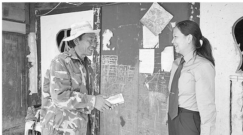
近日，纳雍县检察院检察官来到一起刑事案件被害人家中，为其送来司法救助金，传递法治温度。

架设桥梁，促进各方达成共识。纳雍县检察院有效发挥县委全面依法治县委员会行政检察协调小组议事协调功能和“一手托两家”优势，就速裁强拆执行工作矛盾集中、司法机关和行政部门存在执行分歧的困境，适时通过召开座谈会、听证会等形式，促进得到法院采纳；案件当事人均认罪认罚，法律适用、证据标准、事实认定、执行衔接、执行方法等方面达成共识，服务保障土地执法查处领域行政