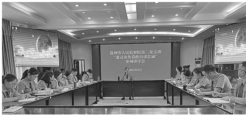
盘州市检察院开展“透过业务看政治讲忠诚”案例讲评会。

“案例培育”与“能动履职”双向促进。盘州市检察院坚持以创新引领检察工作发展，树立“既能办案，又会总结提炼”的办案意识，针对最高检发布的典型案例开展研究学习，深入挖掘自身