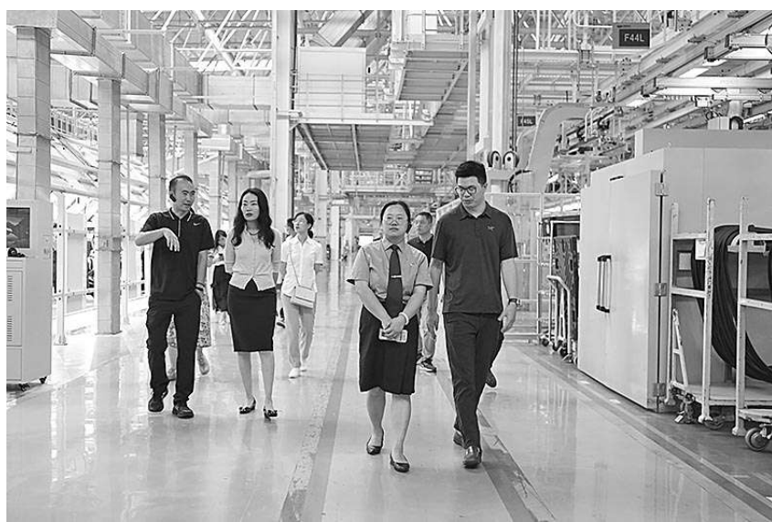
观山湖区检察院检察官走访辖区企业，了解企业生产经营中遇到的法律难题，并送去“法治大礼包”。

涉企民事案件实现精准标识。观山湖区检察院坚持把涉企民事检察案件“入口关”，对所有涉企民事检察案件进行标记，确保全覆盖、无遗漏；建立涉企民事检察案件工作台账，及时掌握案件办理情况，把好涉企民事检察案件“审查关”。目前，该院已实现对全部涉企民事检察案件的精准标识。高质量办理民事生效裁判监督案件。2022年以来，该院办理了涉企民事生效裁判监