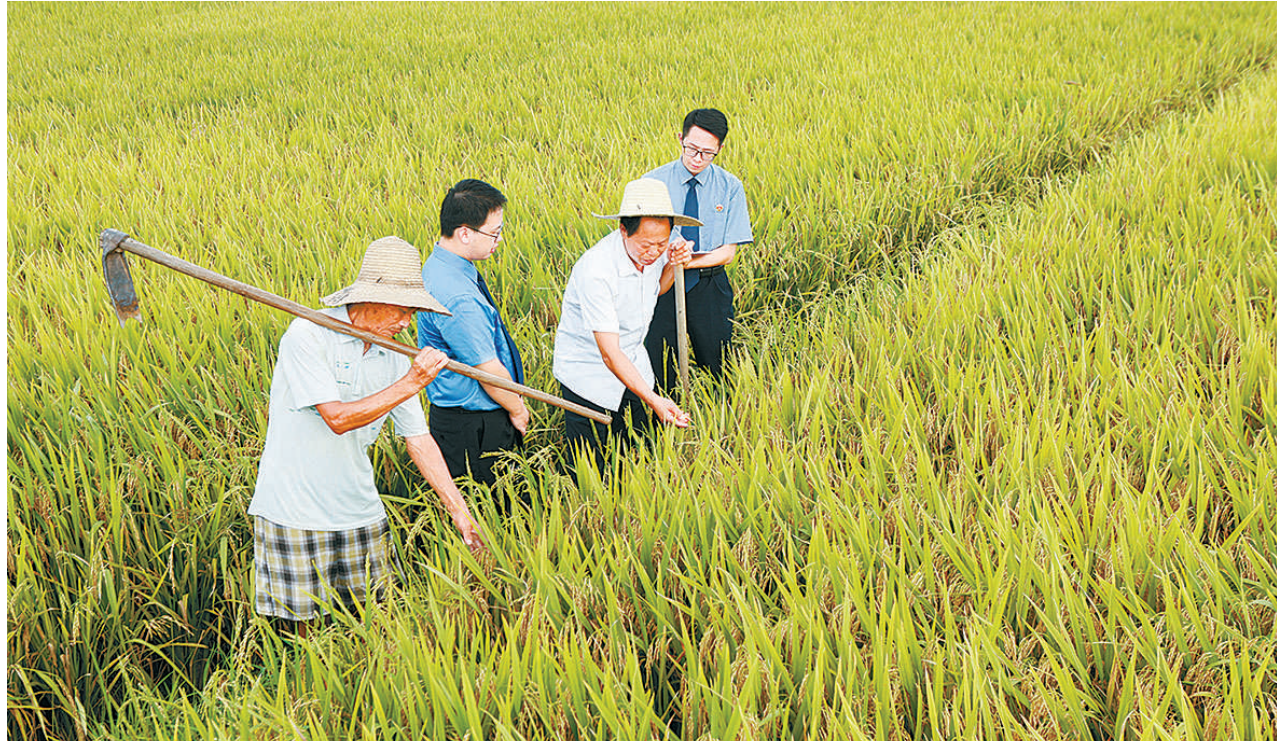
近日,江西省崇仁县检察院检察官到该县三山乡开展涉案耕地修复情况“回头看”,看到曾被非法占用的耕地上已长出稻谷,检察官非常欣慰。因为检察官借走访之机向村民普法。

事故发生后,党中央、国务院高度重视。习近平总书记立即作出重要指示,要求千方百计搜救失联人员,全力救治受伤人员,妥善做好安抚善后等工作。要科学组织施救,加强监