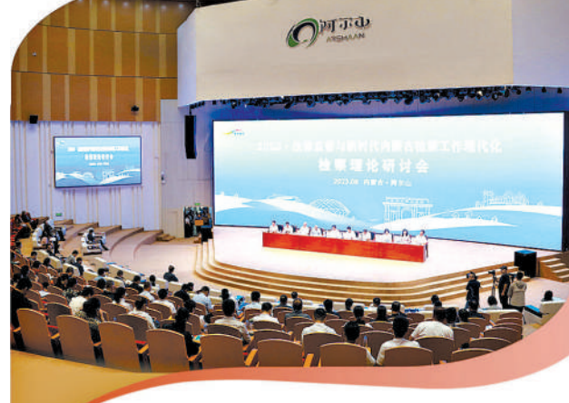
内蒙古首届全区检察理论研讨会举行。

蒙古检察人“提振精神、提升业绩、提高能力、奋力创造与内蒙古区位优势相匹配的检察新业绩”的奋斗征程上。