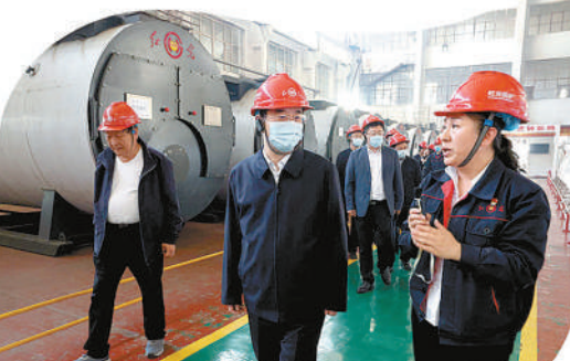
黑龙江省检察院党组书记、检察长刘永志到民营企业调研。