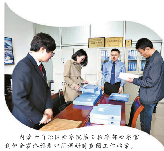
内蒙古自治区检察院第五检察部检察官到伊金霍洛旗看守所调研时查阅工作档案。

5月20日，“全区检察机关河湖保护协作统一行动”启动仪式召开；7月8日，“全区检察机关草原保护协作统一行动”推进会召开；7月9日，“全区检察机关半年工作会议”召开；8月下旬，还有“沿边口岸检察统一行动”“山林保护协作统一行动”推进会等，这些都记录在内蒙古检察人“六大统一行动”与“四大提升工程”的进度表里，也镌刻在内