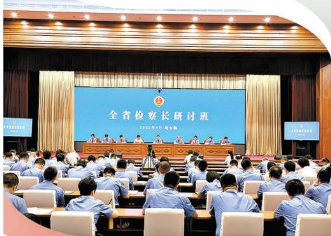
黑龙江省检察院举办全省检察长研讨班。