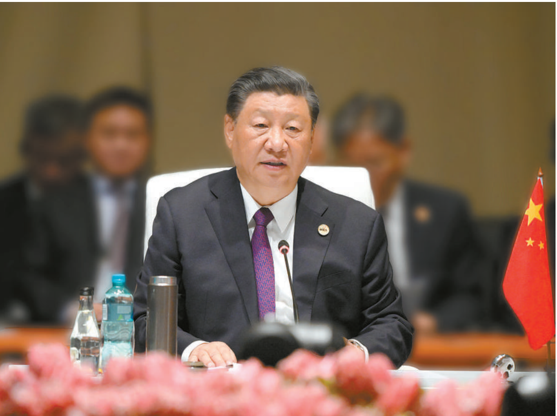
当地时间8月23日上午,金砖国家领导人第十五次会晤在约翰内斯堡杉藤会议中心举行。南非总统拉马福萨主持会晤。中国国家主席习近平、巴西总统卢拉、印度总理莫迪和俄罗斯总统普京(线上)出席。习近平发表题为《团结协作谋发展 勇于担当促和平》的重要讲话。

强调秉持开放包容、合作共赢的金砖精神,以金砖责任应对共同挑战,以金砖担当开创美好未来