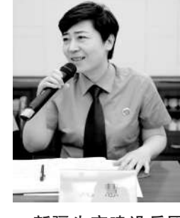
新疆生产建设兵团检察院第七师分院党组书记、检察长 龙慧

习近平法治思想是马克思主义法治理论中国化的最新成果,也是新时代检察机关法律监督工作的根本遵循。我们要结合贯彻习近平总书记视察新疆和兵团重要讲话精神,严格落实党组会议“第一议题”、理论学习中心组学习制度,全面系统学、突出重点学、联系实际学,严格执行重大事项请示报告制度,压紧压实意识形态工作责任制,完整准确贯彻新时代党的治疆方略,牢牢扭住社会稳定和长治久安总目标,忠诚履行检察职责,注重与监察机关的衔接配合,积极主动对公安机关侦查方向、重点、取证方式提出高质量建议,加强对生效裁判、司法调解书以及审判人员违法、执行活动的监督,牢固树立精准监督理念。紧紧聚焦兵团和师党委重点工作部署,找准检察服务保障的切入点、着力点和结合点,持续推进法治化营商环境建设,以服务优化营商“环境之”优”,持续推进七师检察机关与辖区经济开发区沟通联系机制,积极走访调研企业发展过程中存在的问题,为激发市场活力、稳住经济大盘发挥积极作用。