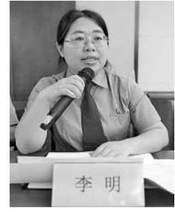
青海省互助土族自治县检察院党组副书记、副检察长 李明

2023年3月,我被授予青海省“人民满意的公务员”荣誉称号。作为一名检察官,要始终坚持把深入学习贯彻习近平新时代中国特色社会主义思想作为首要政治任务,以坚定的理想信念和鲜明的政治立场影响和带动身边人,确保在思想上政治上行动上始终同党中央保持高度一致;始终坚持以习近平新时代中国特色社会主义思想为指导,坚守检察工作的政治灵魂,严格依法、秉公执法,秉承“求极致,过得硬”的要求,不断强化履行法律监督职能,努力让人民群众在每一个司法案件中感受到公平正义,不断增强人民群众的司法获得感、幸福感、安全感;始终把大局作为根本要求。做到会干事、善作为,围绕服务检察工作大局谋划工作,把对党忠诚、为民服务的宗旨落实到推进检察事业高质量发展的具体实践中。今后,我将深刻认识社会治理智慧化的发展大势,牢牢把握新一轮科技革命的历史性机遇,紧跟信息化时代步伐,以数字赋能提升检察工作智慧化水平。