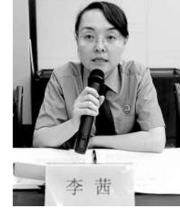
新疆维吾尔自治区沙湾市检察院党组副书记、检察长 李茜

作为一名基层院检察长,我立足检察机关政治属性,认真学习贯彻习近平新时代中国特色社会主义思想,带头把深刻领悟“两个确立”的决定性意义,增强“四个意识”、坚定“四个自信”、做到“两个维护”贯彻到检察履职全过程,坚持“党建带队建,党务强业务”一体理念,政治建检、人才兴检、业务立检,不断厚植党建“底色”,提升队伍“成色”,增添业务“亮色”,努力用“党建红”引领“检察蓝”,主动把检察工作放到大局中谋划和推动,进一步增强当好党委政府“法治参谋”的自觉性,既胸怀“国之大者”,又善办身边“小案”,“用心办好案”回应人民群众关切,“强化溯源治理”帮助解决群众的操心事、烦心事、揪心事,始终将“人民群众是否满意”作为评判案件质量的基本标准,加强新时代检察群众工作,延伸检察服务触角,切实把党的好政策落实到一线;坚持用新理念引领新实践,全面提升法律监督质效,着力推动“四大检察”全面协调充分融合发展,以依法能动履职维护、保障、促进党的领导在司法工作中得到全面落实,努力让人民群众在每一个司法案件中感受到公平正义。