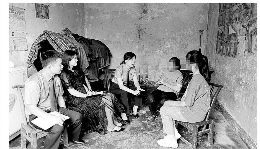
张琼丽代表(左二)和检察官到小七家走访。

本报讯(记者戴小巍 通讯员焦雯雯 廖利)“我被心仪的大学录取了!”近日,湖北省恩施市检察院第五检察部的检察官向丹收到小七(化名)发来的信息。向丹难掩激动,赶快将这一好消息分享给全国人大代表张琼丽。