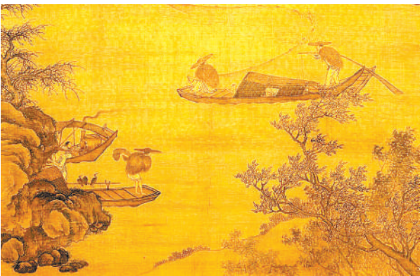
元代画家唐棣《烟波渔乐图》

日本有甘鲷若狭烧，将甘鲷连同鱼鳞一起涂抹上酱汁，用盐腌渍后，再淋上日本酒烧烤而成，鱼鳞微张，金黄酥脆，鱼肉雪白软嫩。带鳞烤制的这种料理，日本人称为立鳞烧或者松笠烧。日本还有一道樱叶糯米蒸甘鲷，是将甘鲷鱼柳、糯米饭与春分时节的樱花烹制而成，日本人说：比起赏樱，感觉吃下去更能体验到花的美感。这样的诗意与雅致，只有叫甘鲷的鱼儿才能配得上。而我们的斧头鱼，名字那般粗犷与豪放，似乎与红烧、火烤更搭，否则，一道美食叫樱叶糯米蒸斧头鱼，清雅得大清雅，粗犷得大粗犷。听上去好生奇怪，好比《水浒传》中的赤发鬼刘唐头戴一枝花，反差实在太大。