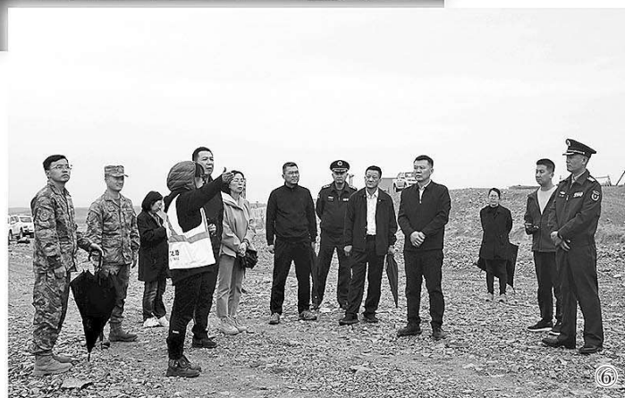
图①:辽宁军地检察机关在海上调查固定相关证据。图②:湖北军地检察机关实地查看军用土地被侵占情况。图③:广东军地检察机关共同分析研判解决方案。图④:四川军地检察机关联合调查。图⑤:西藏军地检察机关实地查看红色遗迹保护情况。图⑥:兰州军事检察院与相关单位现场研究解决方案。