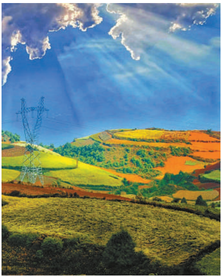
锦绣大地