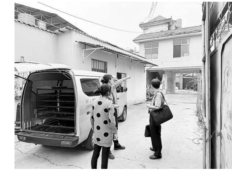
检察官到犯罪嫌疑人家中实地走访。