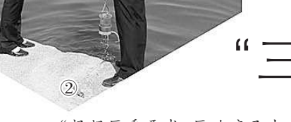
图②:富阳区检察院检察官跟进监督“三无”船舶整治项目,对船舶停泊码头进行水样检测。