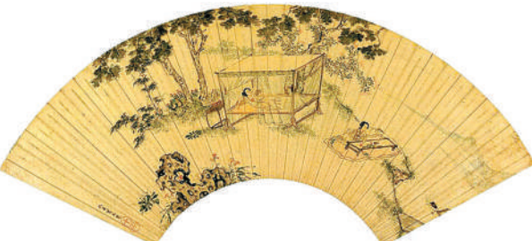
明代画家仇英《消暑图》

酷热的日子里，准备一些乌梅、红糖，在砂锅里添水，放入乌梅和红糖，用文火慢慢来熬，直到乌梅肉彻底熬尽，化入黏稠的汁水中，熬得的汤汁滤去渣滓，兑入适量的凉开水，冰镇一下，喝上一碗，酸而不涩，甜而不腻，端的是百年的气质和风情，亲切和婉，仪态万方。那层层渐渐递进的酸爽清香的感觉，那酸味甜味一路纠缠的缠绵，真是让人疲累俱消，心意悠然，欲罢不能。