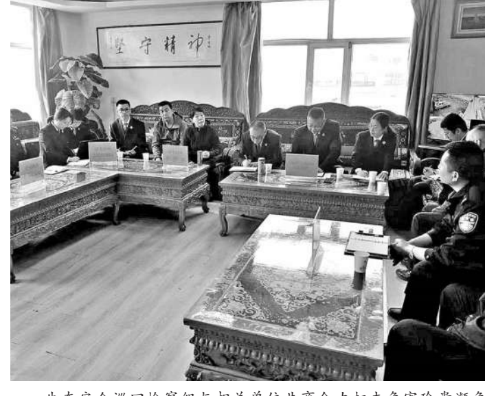
生态安全巡回检察组与相关单位共商合力打击危害珍贵濒危野生动物犯罪活动机制。