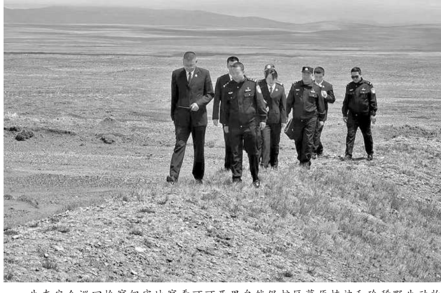
生态安全巡回检察组实地考察可可西里自然保护区草原植被和珍稀野生动物保护管理情况。