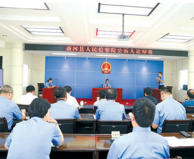
商河县检察院举办公诉人论辩赛活动。