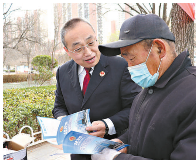
商河县检察院开展“3·15”国际消费者权益日法治宣传活动。