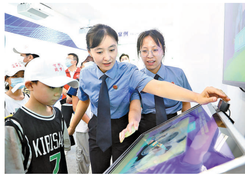
商河县检察院举行检察开放日活动,在孩子们心中种下法治种子。

该院充分认识到,大数据是助力法律监督的“科技翅膀”,在深度开展行政非诉执行监督大数据智慧检察务系统等创新应用的同时,积极拓展可视化系统应用,以智能化手段解放检