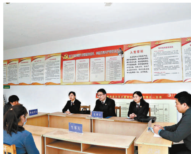
商河县检察院开展上门听证,切实将矛盾化解在群众家门口。