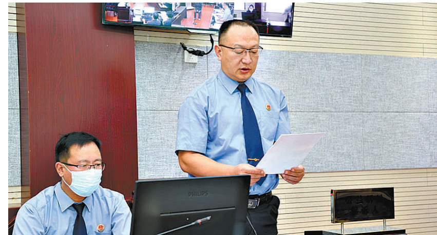
商河县检察院检察长出庭支持公诉一起滥伐林木刑事附带民事公益诉讼案。