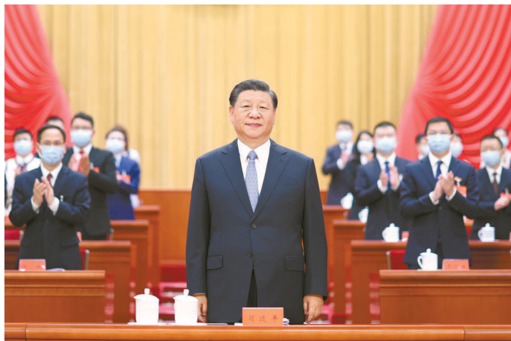
6月19日,中国共产党第十九次全国代表大会在北京人民大会堂开幕。这是中共中央总书记、国家主席、中央军委主席习近平在主席台向与会代表致意。