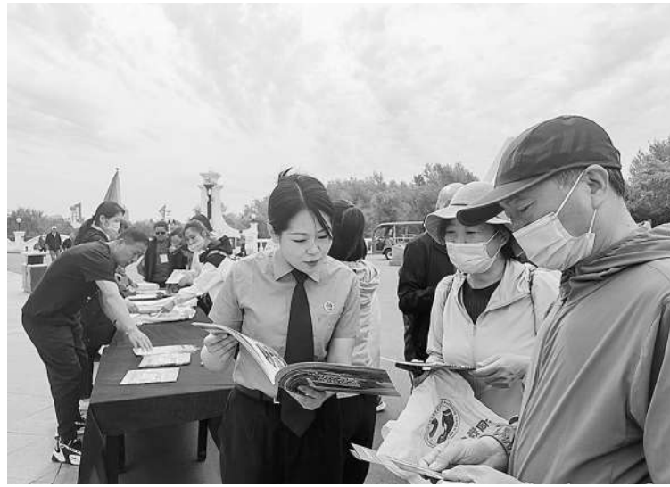
检察官向群众宣传湿地保护相关法律知识。