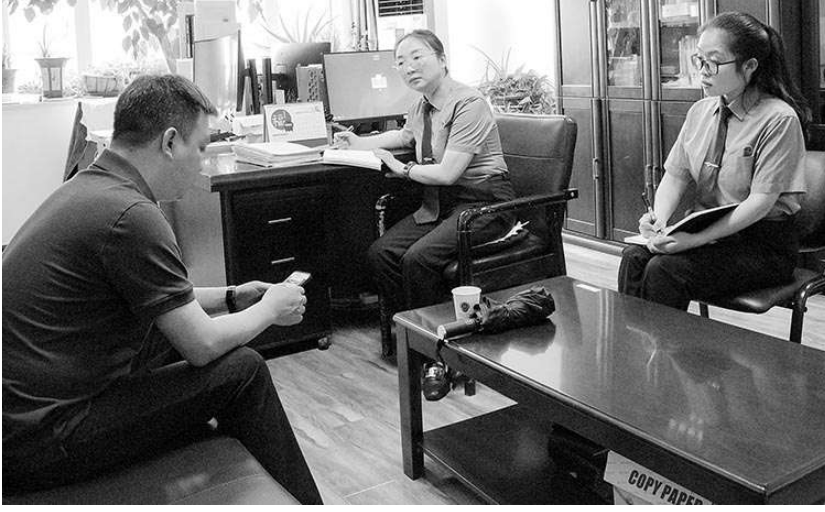
本报通讯员曹正芳 陈文珍摄

近日,贵州省龙里县检察院受理一起申请行政检察监督案件,通过办案检察官释法说理,提出监督申请,某企业法定代表人王某在熟悉相关法律规定、解开法结心结后,主动向检察机关递交撤回监督申请书。办案中,检察官在调查核实后,并没有简单地以“一纸文书”告知其不支持监督,而是融法理于情理,多次通过电话、微信等方式与王某沟通交流,详细告知查明情况和法律依据,耐心释法说理,最终使其解开了心结,消除了疑虑。