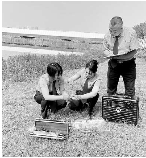
检察官提取湿地水样和土壤进行检测。