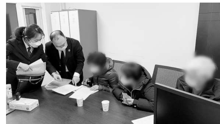
在检察官与法官的组织和见证下,当事人签署和解协议。