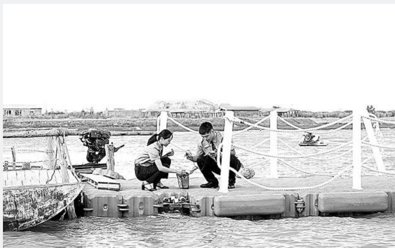
近日,内蒙古自治区克什克腾旗检察院干警到这里诺尔湖、公主湖等地开展巡河行动,现场使用便携式公益诉讼快检设备对采集水样的pH值、含氧量、氨氮含量等情况进行检测。