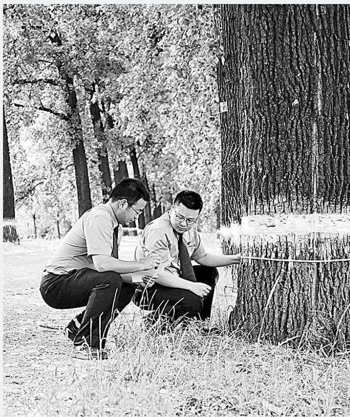
江苏省睢宁县检察院检察官近日对古树名木保护情况进行现场调查。

值主要体现在生物多样性价值、科学研究价值、维持食物链完整价值等6个方面;负价值主要体现在牧草损失、牲畜损失等4个方面。据此最终综合分析评估得出,涉案经济价值1000万元、生态环境损害赔偿价值79万余元。 据了解,野牦牛是国家一级保护动物,为青藏高原特有物种,具有较高的经济价值和极为显著的生态价值。上述两起案件中,由于野牦牛幼崽被非法猎捕脱离原栖息地和原种群,不仅直接导致查乌马地区野牦牛种群数量减少,也将对种群的繁衍生长造成影响,破坏野牦牛所在的营养级和原栖息地的生态环境平衡,进而影响青藏高原的区域生态环境。 鉴定评估报告的出具,既解决了对野牦牛生态环境损害赔偿价值的鉴定评估问题,也为检察机关提出附带民事公益诉讼相关诉求提供了科学、精准、合理的数据支撑。今年2月,三江源地区检察院对丹某等8人依法提起刑事附带民事公益诉讼。