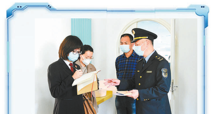
2022年5月初,浙江省衢州市检察机关开展婴幼儿照护服务机构规范化发展专项行动。

近年来,各地检察机关纷纷搭建了未成年人检察数字监督模型,借助大数据碰撞发现问题,通过数字化应用靶向施治,以“数字赋能”提升未成年人司法保护质效。