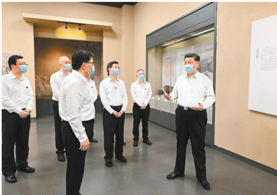
5月16日下午,中共中央总书记、国家主席、中央军委主席习近平在前往陕西西安主持中国—中亚峰会途中,在山西运城博物馆考察。

新华社陕西西安/山西运城5月17日电 中共中央总书记、国家主席、中央军委主席习近平在听取陕西省委和省政府工作汇报时强调,陕西在推进中国式现代化建设中要有勇立潮头、争当时代弄潮儿的志向和魄力,奋力追赶、敢于超越,在西部地区发挥示范作用。要完整、准确、全面贯彻新发展理念,紧紧围绕高质量发展这个首要任务,着眼全国发展大局,立足陕西实际,发挥自身优势,明