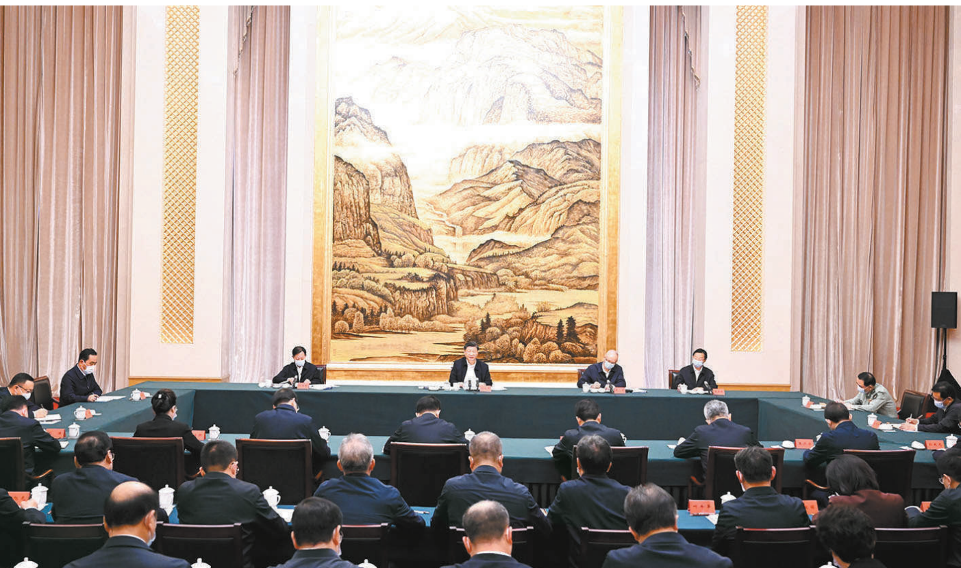
5月17日上午,中共中央总书记、国家主席、中央军委主席习近平在陕西西安主持中国—中亚峰会前夕,专门听取陕西省委和省政府工作汇报,发表了重要讲话。