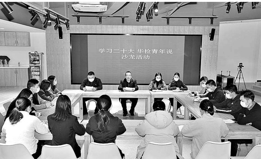
五华县检察院举办“学习二十大 华检青年说”沙龙活动。

培养“匠人”,以严管厚爱涵养清正廉洁。五华县检察院建立荣誉室、图书室、党员活动室等文化场所,精心布局规划楼宇空间,在办公楼各楼层设立特色检察“文化走廊”,形成“一楼一主题、一层一特色”的检察文化空间。开展先进典型选树活动,充分发挥检察英模和身边先进典型的示范引领作用。定期开展廉政家访,将人文关怀融入检察队伍建设,切实解决干警后顾之忧。严格执行新时代政法干警“十个严禁”“三个规定”重大事项填报等制度,组织开展警示教育专题课、参观警示教育基地、观看警示教育微电影等活动,对青年干警纪律作风加强督导。