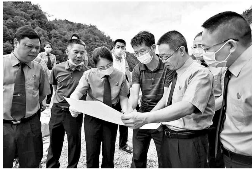
平远县检察院开展跨区域“巡山问水”行动。

护航红色根脉,充分发掘文物再生价值。平远县作为原中央苏区县,拥有丰富的红色资源。为守护红色根脉,促进红色资源活化利用,平远县检察院开展红色资源、文物和文化遗产保护公益诉讼专项活动,会同相关部门建立联动协作工作机制,通过主动调查和联合排查等方式,对革命文物、烈士纪念设施、重要人物旧居故居等进行全面摸排,三年来共办理红色资源、文物保护领域公益诉讼案件24件,及时维护39处红色遗址、文物和历史建筑的形象和安全,以实际行动守护传承红色基因。