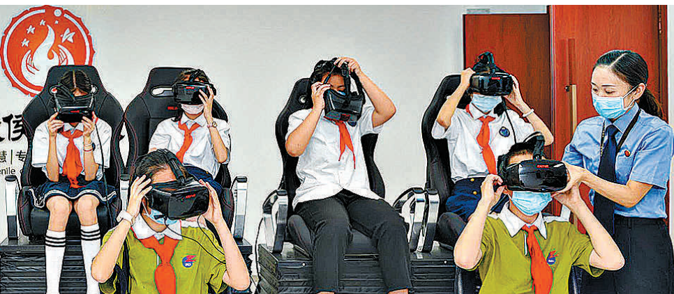
2020年5月，四川省成都市武侯区检察院组织学生通过VR设备体验虚拟庭审。

“问题制剂全部下架，相关问题已整改。”日前，江苏省无锡市新吴区检察院检察官和相关单位负责人到辖区部分药店进行回访时，了解到相关单位已强化了对“消”字号产品的生产经营全链条监督。 “消”字号产品即“消”字号抗(抑)菌制剂，它并非药品，却暗藏猫腻，存在违规添加化学药物的现象，会引发过敏反应，导致一系列副作用，甚至可能严重危害婴幼儿的身体发育及身体健康。 2022年6月，新吴区检察院接到群众反映：“抹了从药店买的消炎药膏，过敏反而更严重了。”该院立即展开调查，发现该类问题药膏属于“消”字号产品。 2022年8月，新吴区检察院依托已有的公益损害风险防控软件，创新开发了“消”字号产品智能辅助办案系统。检察官将问题制剂信息导入数据模板，链接药店的网络销售平台，采集药店内药品信息，经过数字化比对，排查出销售问题制剂的药店及其所在位置。一天之内，就完成了对无锡市及邻市2000余家零售药店的排查。 经过5个月的专项监督，新吴区检察院累计找到无锡市7家出售问题“消”字号产品的药店。2022年8月至11月，该院向相关职能部门制发磋商函、检察建议，督促相关职能部门依法履职、加强监管，并将发现的辖区外案件线索分别向相关检察机关移送。 收到检察建议后，相关职能部门组织专题研究和情况分析，制定了专项整治方案，对辖区“消”字号产品经营单位进行随机抽查，对销售问题制剂的药店进行处罚。 截至目前，相关问题已整改到位。与此同时，新吴区检察院通过“消”字号产品智能辅助办案系统，实时更新问题制剂信息库，实现在售问题药品“一键搜集”。