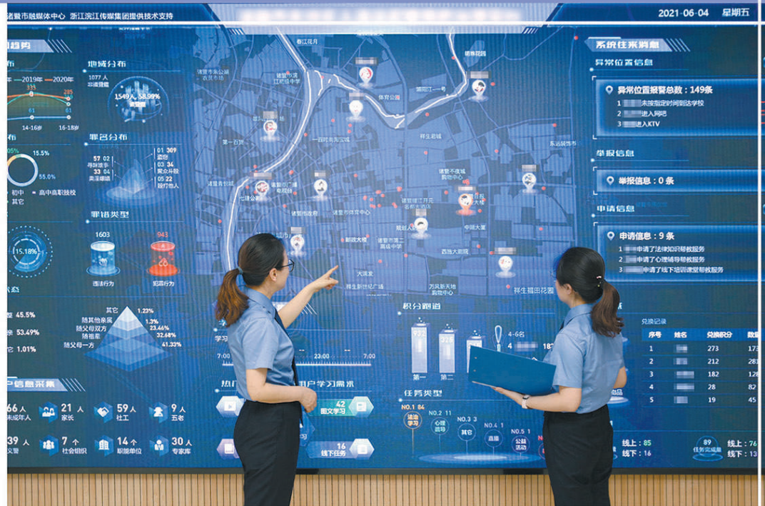
2022年6月，浙江省绍兴市检察院干警在大数据监督平台前了解情况。本报记者范跃红 通讯员董佳丽摄(资料图片)

理、构建法律监督新格局打下了坚实的基础。大数据赋能驱动新时代法律监督提质增效，契合了社会治理现代化的更高要求。希望检察机关积极推动数字化改革，加大对数字检察人力、财力、物力的支持和投入，切实依靠数字赋能提升检察工作效能。同时，加强与其他政法单位、政府部门的联动，通过大数据驱动打破部门壁垒，靠前研判，以类案监督推进诉源治理。