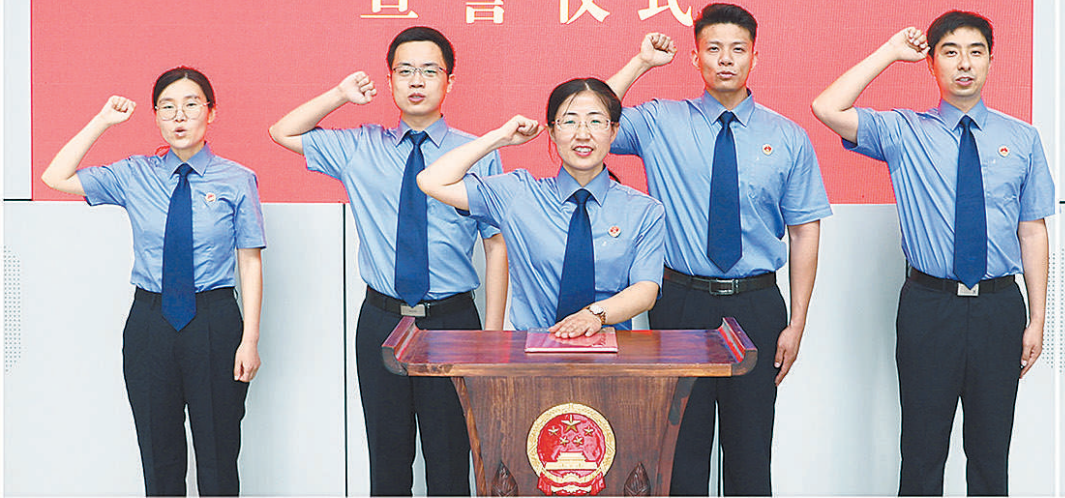
2022年6月，河北省定州市检察院举行新入额检察员宣誓仪式。