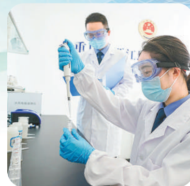
检察干警对日常巡查中提取的水样进行检测分析。

重庆市两江地区检察院设立2年多来，共办理公益诉讼案件76件，其中11件获评全国或重庆市检察机关典型案例，1件获评“中国十大环境司法案例”，长江上游生态环保检察的品牌效应初显。